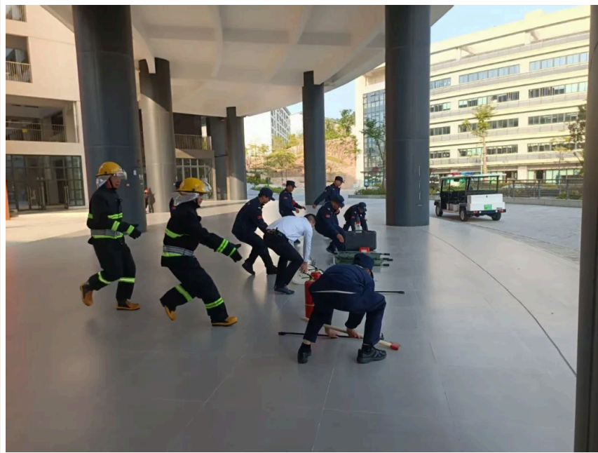
左右滑动查看更多

日常培训中，我们摒弃“形式化”培训，注重实操性和针对性，严格遵循公司培训标准，构建“月度核心+定期补充”的全维度培训体系，将安全培训、消防培训、应急培训与防汛培训有机整合，避免内容重复，常态化锤炼安保队伍专业能力。其中，月度专项培训以安全、消防与应急处置融合为核心，结合过往典型安全案例，系统讲解突发火情的识别、初期扑救技巧、消防器材（干粉灭火器、消防水带等）的规范使用，同步联动应急处置全流程培训，涵盖火情、汛情等突发情况的应急响应、人员分工、协同配合、上报流程等核心内容，还专门突发火情、复杂地形火情等贴合项目实际的场景，组织全体安保人员实战演练，让每一位队员既能熟练掌握消防实操技能，也能精准应对各类应急场景。